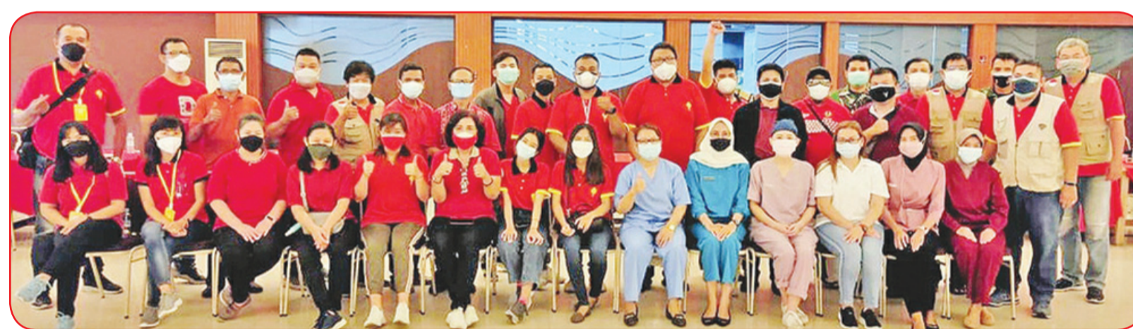
Para peserta berfoto bersama setelah vaksinasi.

Pada 28 hingga 30 Juli lalu, PTT (Paguyuban Tionghoa Tasikmalaya), Asia Plaza dan Bamag (Badan Musyawarah Antargereja) serta Kodim 0612/Tasikmalaya menyelenggarakan vaksinasi.