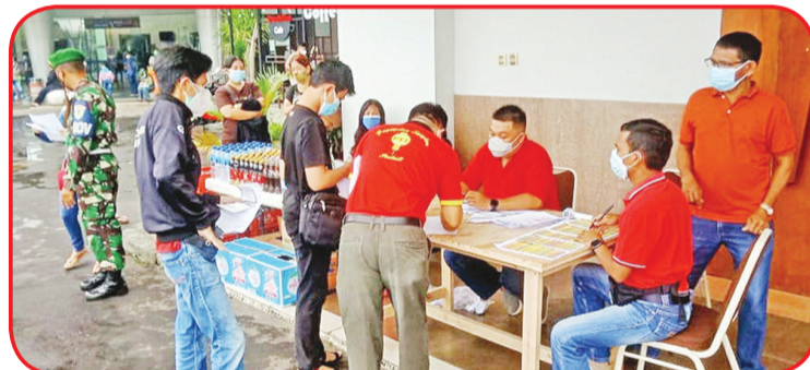
Suasana di bagian pendaftaran.

Satgas Covid yang datang meninjau, mengapresiasi metode kegiatan vaksinasi yang dirancang Asia Plaza. Yang bukan hanya mematuhi protokol kesehatan dengan ketat,