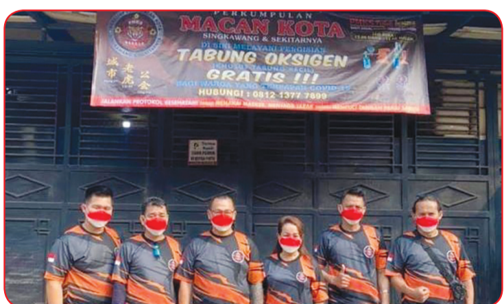
Pengurus Perkumpulan Macan Kota Singkawang dan sekitarnya berfoto bersama.

JAKARTA (IM) - Perkumpulan Macan Kota Singkawang dan sekitarnya Senin (2/8) lalu menggelar aksi sosial dengan membagikan vitamin C dan D secara gratis kepada warga di kawasan Teluk Gong Jakarta Utara.