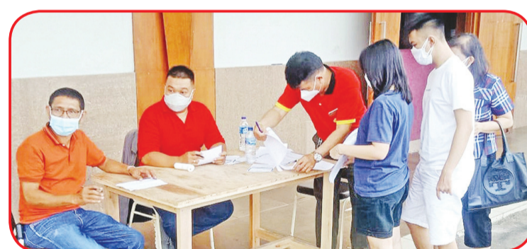
Relawan muda di bagian pendaftaran.