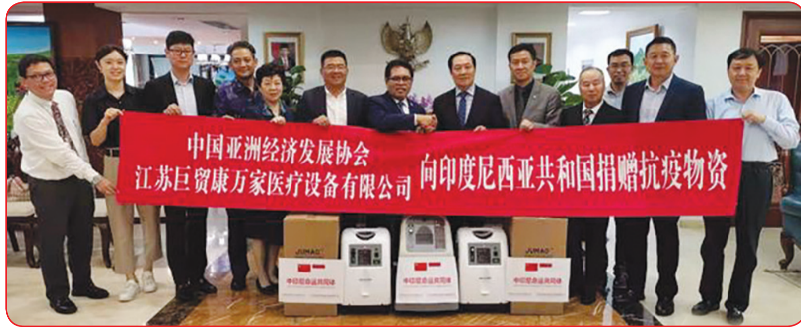
Prosesi penyerahan 100 unit oxygenator yang berlangsung di Kedubes RI untuk Tiongkok.