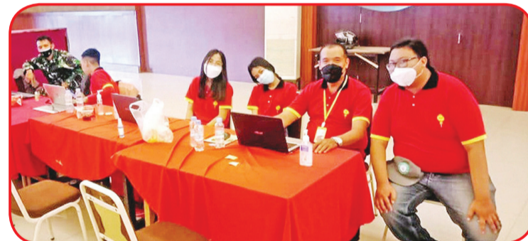
Relawan di bagian pencatatan.