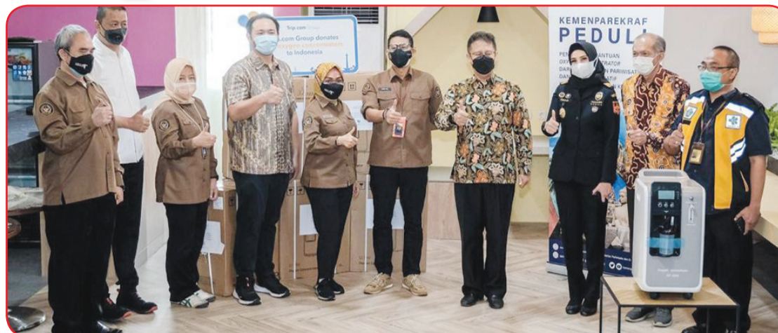
Foto bersama usai prosesi serah terima donasi.

JAKARTA (IM) - Kemenparekraf (Kementerian Pariwisata dan Ekonomi Kreatif/Badan Pariwisata dan Ekonomi Kreatif) menerima donasi 130 unit Oksigen Konsentrator dari Trip.com Group Tiongkok yang berkantor pusat di Shanghai, Tiongkok, untuk diserahkan ke Kementerian Kesehatan