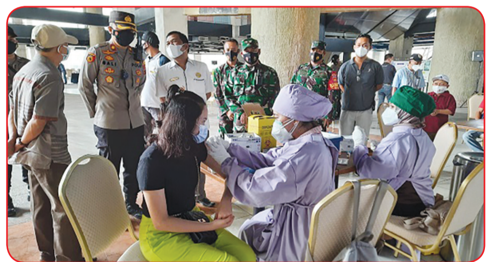
Kodam IV Diponegoro, Nasmoco Group, PSMTI Jateng dan Setos menggelar vaksinasi untuk masyarakat.

"Diharapkan dengan adanya program vaksinasi ini dapat membantu pemerintah dalam melakukan penanganan Covid-19. Sekaligus menuju pemulihan ekonomi nasional menuju Indonesia Sehat, Ekonomi Bangkit," tandas Agus Dwi Parwoko. • idn/din