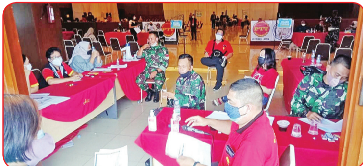
Para relawan sibuk bertugas di lokasi kegiatan.

Selain itu juga menyatakan terima kasih kepada para donatur yang tidak mau disebutkan namanya serta Asia Plaza yang telah menyediakan nasi kotak gratis, bakpau, roti dan berbagai jenis makanan ringan yang diberikan kepada petugas yang berpartisipasi. • idn/din