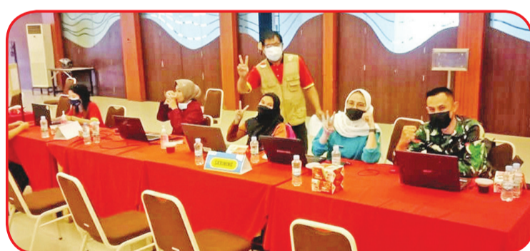
Staf medis dan relawan yang berpartisipasi dalam kegiatan vaksinasi.