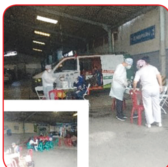
Suasana kegiatan vaksinasi yang diselenggarakan LMK Gunung Sahari Utara, Jakarta Pusat.

JAKARTA (IM) - Program vaksinasi Covid-19 terus digencarkan di kawasan Ibu Kota.